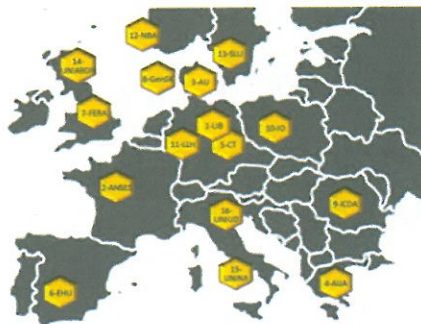
Εικόνα 1: Οι χώρες που συμμετέχουν στο Ευρωπαϊκό ερευνητικό πρόγραμμα SMARTBEES ( http://www.smartbees-fp7.eu ).

Θα εφαρμοστούν οι πλέον καινοτόμες μέθοδοι για να αντιμετωπιστούν τα παθογόνα παράσιτα στις μέλισσες καθώς και η μείωση της βιοποικιλότητας των μελισσών που έχουν ως αποτέλεσμα σημαντικές απώλειες. Θα εντοπιστούν οι μηχανισμοί αντίστασης και το αντίστοιχο γενετικό υπόβαθρο των μελισσών στο Varroa και τους ιούς, ιδιαίτερα εκείνων της παραμόρφωσης των πτερυγών (DWV), χρησιμοποιώντας τις πιο σύγχρονες διαθέσιμες γενετικές και μοριακές μεθόδους. Θα μελετηθεί η γενετική ποικιλότητα των μελισσών της Ευρώπης και θα βελτιωθεί με τη χρήση των κατάλληλων μεθόδων. Θα αναπτυχθούν στρατηγικές για την ενίσχυση και προστασία αυτών των πολύτιμων χαρακτηριστικών στους ανθεκτικούς ντόπιους πληθυσμούς μελισσών ικανοποιώντας τις ανάγκες των μελισσοκόμων.